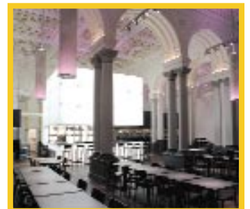
Visualisierung: Eiblet Engine Steuerung Licht- szenen: Schaltuhr mit astronomischer Zeit.