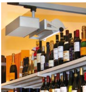
Video-Überwachung und Beleuchtung